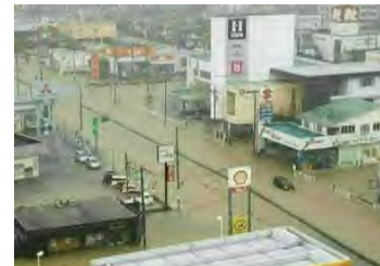
(平成30年7月 福山市蔵王排水区)