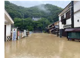
(令和3年7月 竹原市本川排水区)