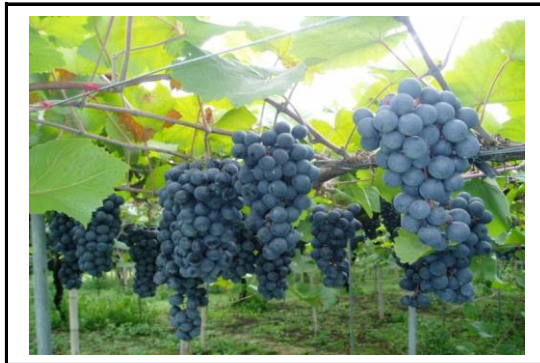
マスカット・ベリーA(ぶどう)