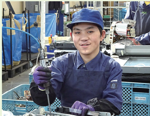
登録企業へ就職した生徒