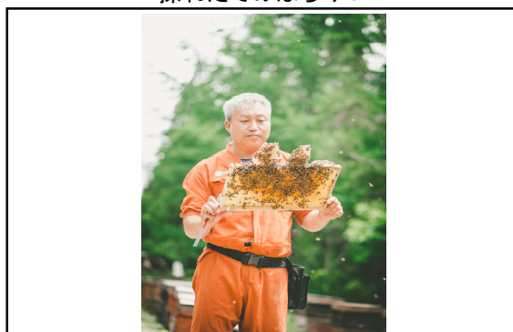
みつばちの生育状況の確認