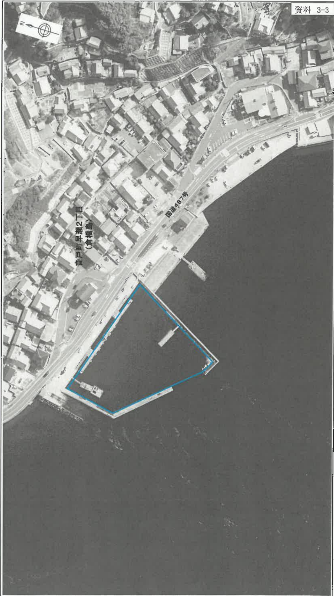
小型船舶用泊地の区域 □