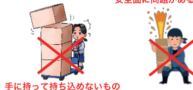
手に持って持ち込めないもの