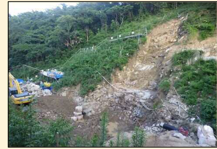
(5) 2020.8 本堤掘削完了