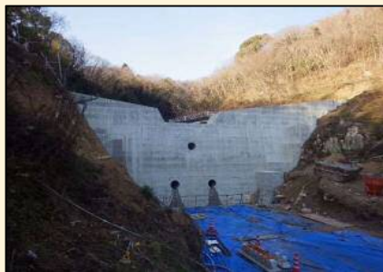
(10) 2021.4 前庭保護工