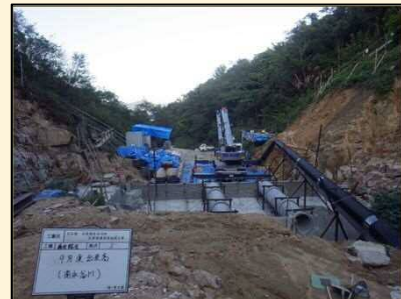
(7) 2020.10 本堤工(コンクリート)②