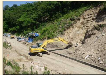
(4) 2020.7 本堤掘削状況③