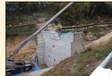
(9) 2021.1 本堤工完了