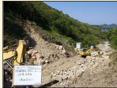
(3) 2020.6 本堤掘削状況②