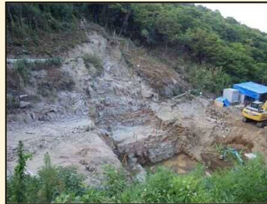
(6) 2020.9 本堤工(コンクリート)①