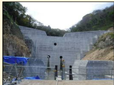
(11) 2021.8 道路復旧工