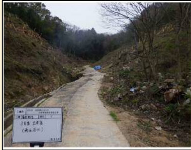
(2) 2020.4 本堤掘削状況①