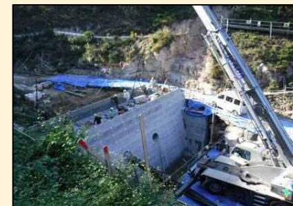
(8) 2020.12 本堤工(コンクリート)③