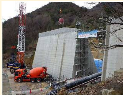
(8) 2020.3 本堤打設完了