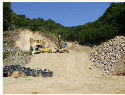
(3) 2019.8 本堤掘削状況②