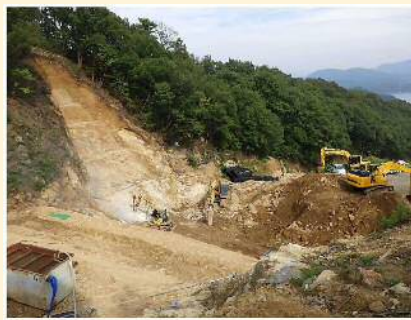
(4) 2019.9 本堤掘削完了