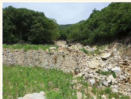
(2) 2019.7 本堤掘削状況①