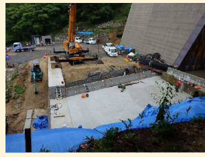
(12) 2020.7 堰堤工完了