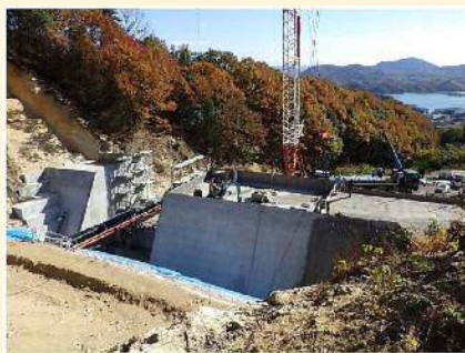
(7) 2020.2 本堤打設状況③