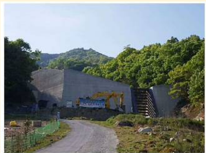
(10) 2020.5 前庭保護工及び取付水路①