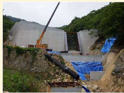
(11) 2020.6 前庭保護工及び取付水路②