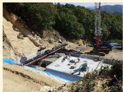
(6) 2019.11 本堤打設状況②