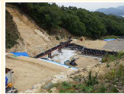
(5) 2019.10 本堤打設状況①