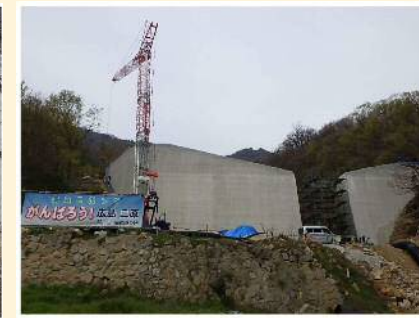
(9) 2020.4 鋼製堰堤(スリット)完了