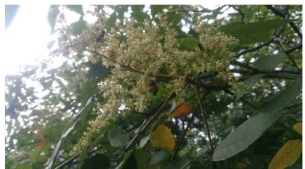
ミツバチが訪花している様子(ヌルデの花/9月)