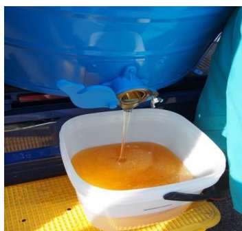
収穫したはちみつ(写真は5月上旬)