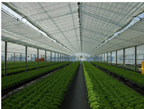
遮光カーテン展開時