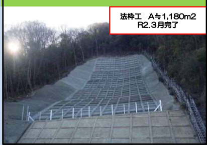
川尻地区(尾道市向島町兼広)