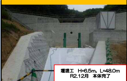
東五反田川隣(尾道市吉和町)