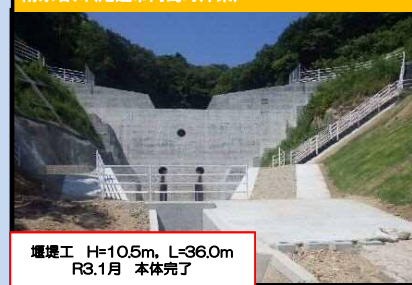
南永谷川(尾道市向島町沖条)