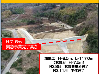
東鳴滝城川隣2(尾道市吉和町)