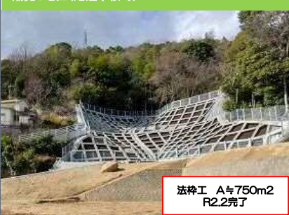
潮見G地区(尾道市桜町)

堰堤工 H=9.5m, L=117.0m (緊急分 H=7.5m) R2.8月 緊急事業分完了 R2.11月 本体完了