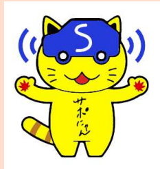
広島県安全運転サポート車普及啓発協議会キャラクター「サポにゃん」