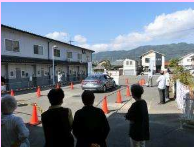
府中市広谷公民館（令和3年10月）