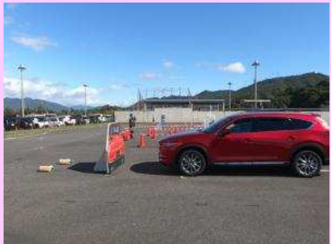
広島県運転免許センター（令和3年10月）

サポカー体験講習会の開催に関する相談は、最寄りの警察署又は県警運転免許課（082-228-0110(代表)）へお問い合わせください。