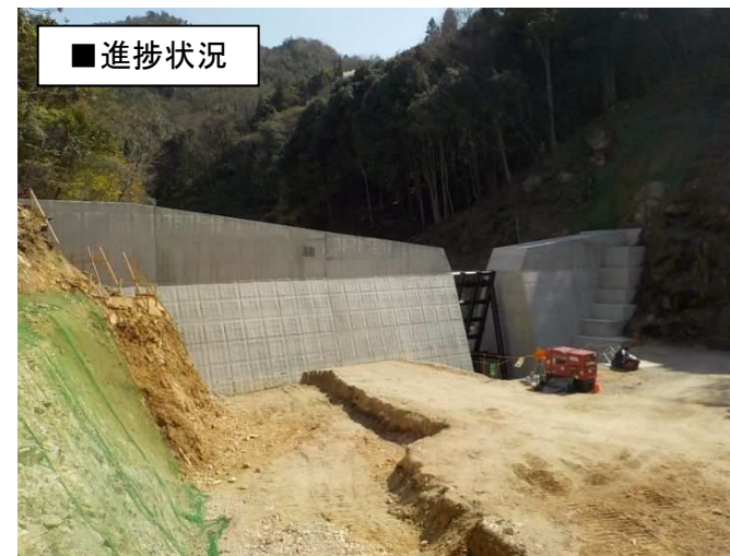
工事完了（令和3年3月29日）