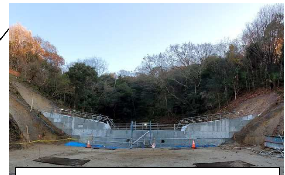
工事完了（令和3年1月15日）

設計：株式会社オリエンタルコンサルタンツ 施工：宮川興業株式会社 発注：西部建設事務所