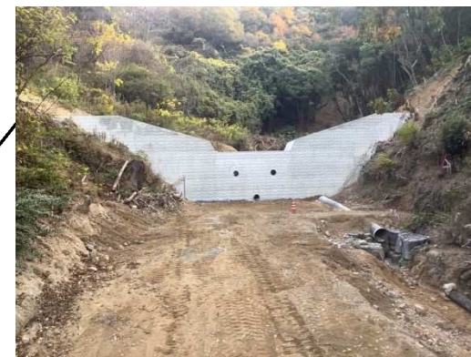
工事完了（令和2年12月18日）

設計：株式会社 オリエンタルコンサルタンツ 施工：株式会社 SUMIDA 発注：西部建設事務所