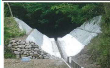
《利用しなくなったため池の廃止工事》