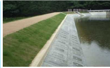
《利用するため池の補強工事》

《迅速な避難行動につなげる対策》 ため池の位置や決壊時の浸水想定区域の情報を住民に提供することにより、豪雨時などにおける住民の迅速な避難へ繋げる。