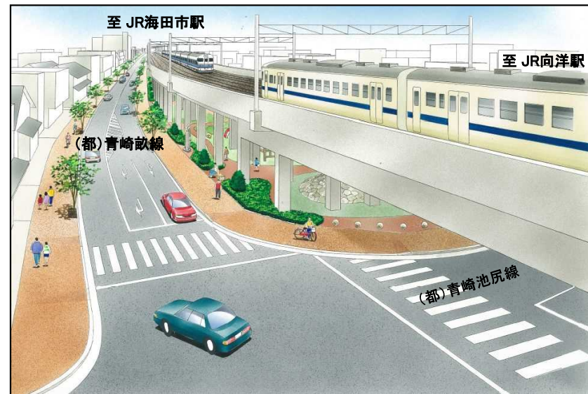
鉄道高架と関連街路の整備イメージ(JR向洋駅付近)