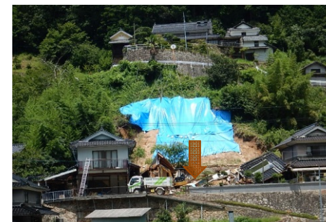
斜面崩壊・被災状況（H30年7月）