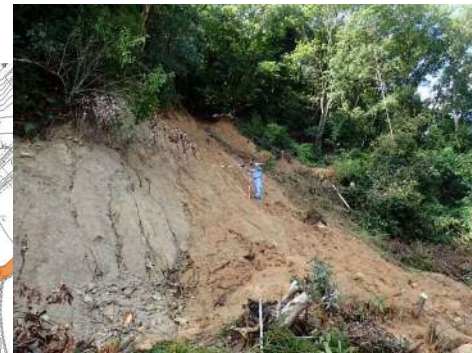
斜面崩壊・被災状況（H30年7月）