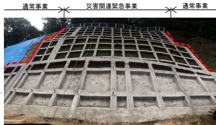
工事完了（令和2年8月11日 予定）