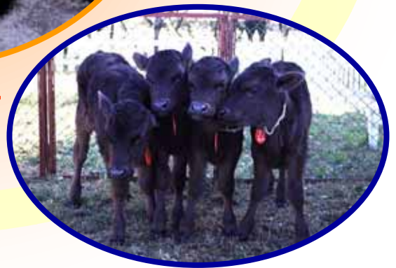
<四つ子のクローン牛> この牛の肥育成績により 種雄牛を検定