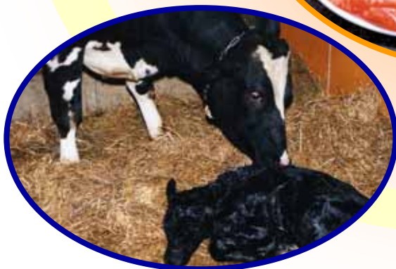
<クローン牛の誕生>