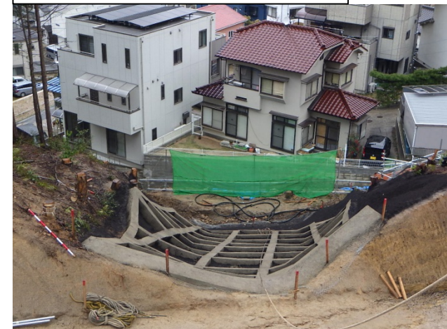
工事完了（令和2年3月30日）