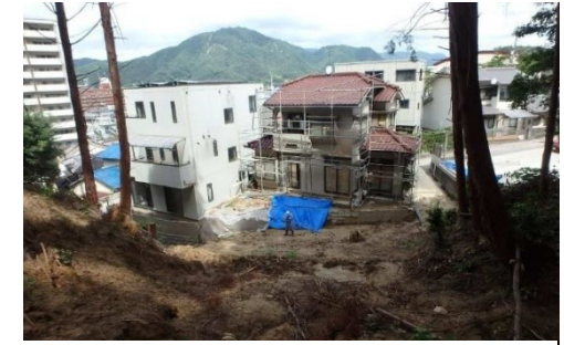
斜面崩壊・被災状況（H30年7月）