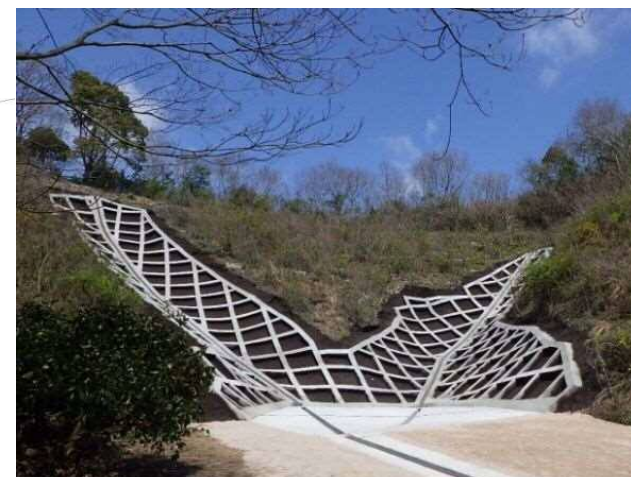
工事完了（令和2年3月24日）