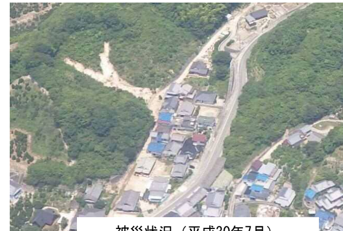
被災状況（平成30年7月）