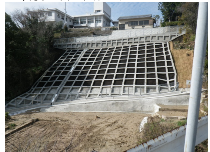
工事完了（令和2年1月31日）