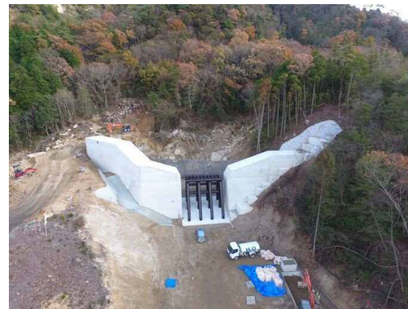
工事完了（令和元年12月3日）

設計：株式会社 荒谷建設コンサルタント 施工：(株)熊野技建 発注：西部建設事務所