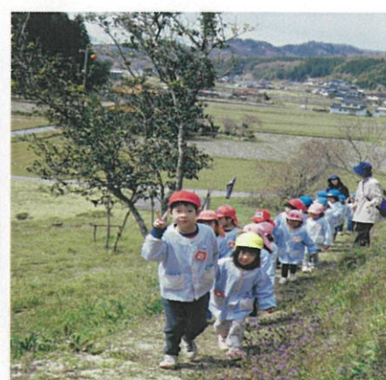
異年齢で手をつなぎ、年長児が先導します。