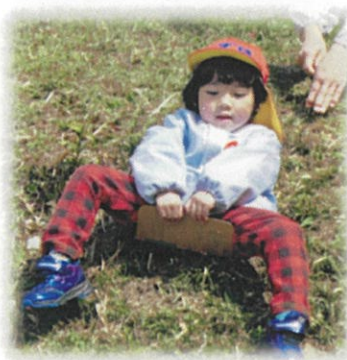
ダンボールで草滑り。