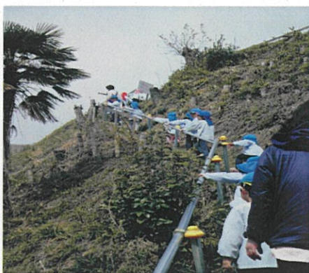
高く急な細い道も登ります。