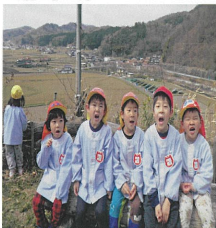
山頂に登り、一休みします。

尾首城には、広場や展望台があり、上り坂や山道もあるため、遊びながら体力を身に付けることも可能と考える。