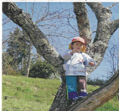
木登りも体験できます。