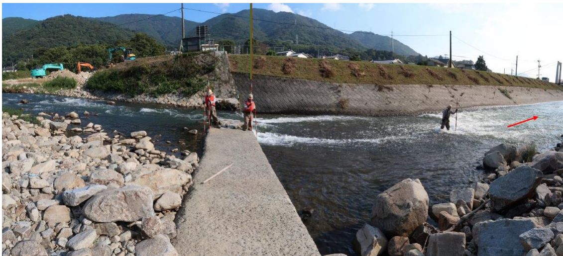
左岸側現況（着工前）

◆概要◆ 工事箇所：呉市広石内三丁目 二級水源地下（その2） （平成30年災害第5122号） 主な工種：落差工（延長=19.0m（左岸側）、26.3m（右岸側）） ：根固工（延長=10.2m（上流側）、49.4m（下流側））