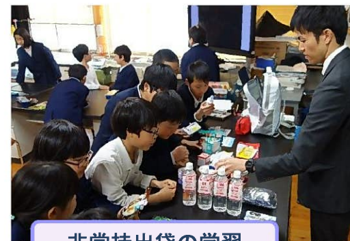
非常持出袋の学習