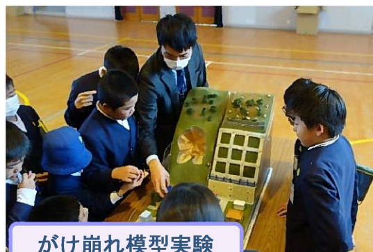
がけ崩れ模型実験