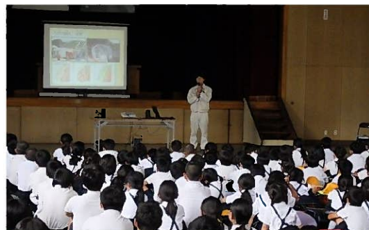
東部建設事務所三原支所職員による講義