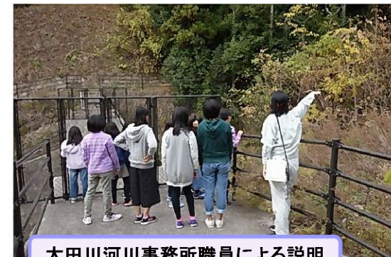
太田川河川事務所職員による説明