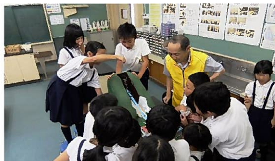
砂防ボランティアによる指導