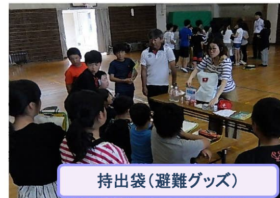
持出袋(避難グッズ)