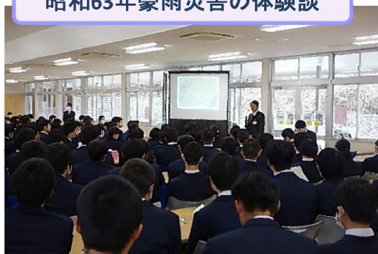
昭和63年豪雨災害の体験談