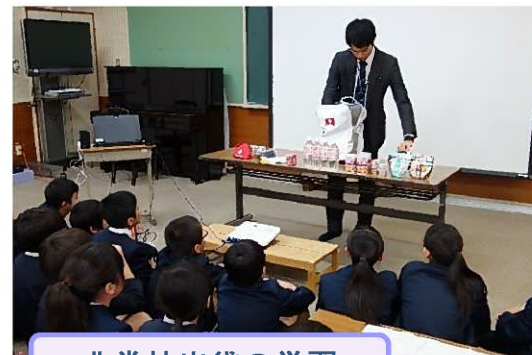
非常持出袋の学習