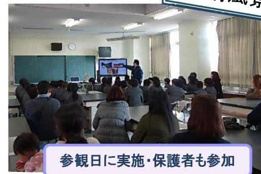
参観日に実施・保護者も参加