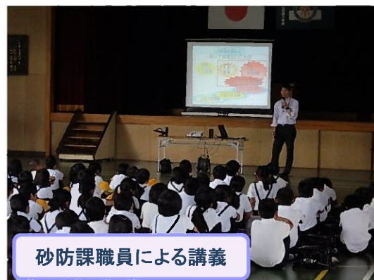
砂防課職員による講義