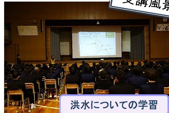
洪水についての学習