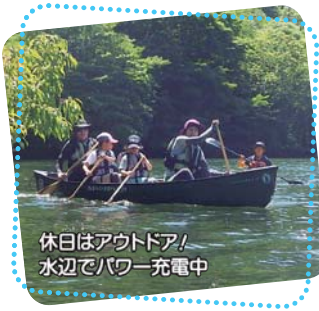
休日はアウトドア! 水辺でパワー充電中