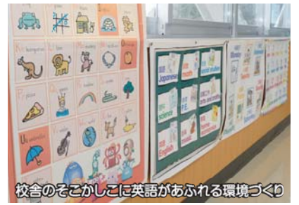
校舎のそとがこに英語があふれる環境づくり

先生 児童に英語を教えるだけでなく、他の先生方にも英語教育の研修を行っています。責任が大きいだけに、すごくやりがいがありますね! 英語を勉強することは、違う文化を受け入れられるようになることでもあります。児童は言葉が分かってくると、外国から来たALT(外国語指導助手)と生き生きとコミュニケーションをとるようになります。異文化交流を行うことは、人を大切にすることを育むことにもつながると考えているので、英語や外国の文化があふれる教育環境をつくりたいな、と思って取り組んでいます。