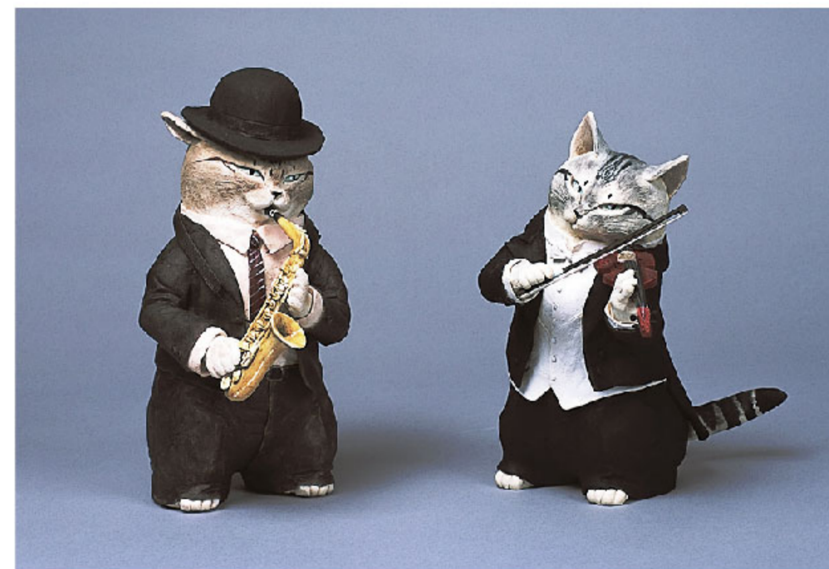
▲楽団の猫「バイオリン」「サクソフレイヤー」 正木卓

気まぐれだけど愛くるしく、神秘的な「猫」。多くの芸術家を魅了し、作品のモチーフにされてきました。竹久夢二、藤田嗣治、歌川国芳を始め、様々な芸術家の「猫アート」をお楽しみください。