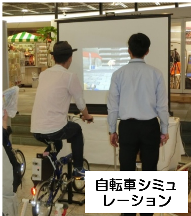
自転車シミュレーション

JAF(日本自動車連盟)のブースでは「子ども安全免許書」の発行をしていました。JAFと言えば自動車ユーザーへのイメージがありますが、年に十数校の高校に赴き、交通安全教室(座学)を行うといった活動だけでなく加害者にもなり得ることがクローズアップされるなかで、子供を対象とする啓発活動も、結局は「交通事故を起こしてほしくない」という思いにつながっている。」と話されていました。