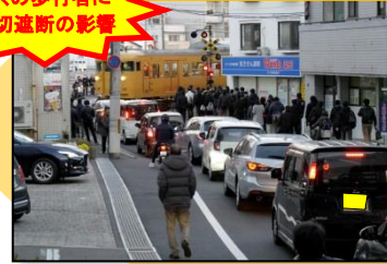
青崎第10踏切(府中町) (歩行者ボトルネック踏切)