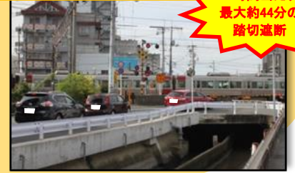
新町踏切(海田町) (開かずの踏切)