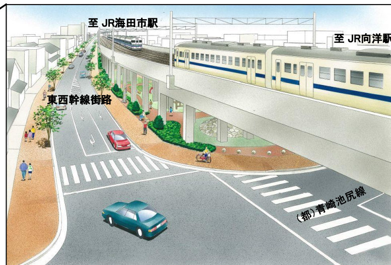
鉄道高架と関連街路の整備イメージ(JR向洋駅付近)