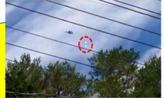
フレア発射訓練(H29.10 北広島町)