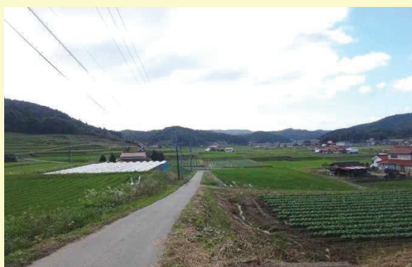
同法人が営農活動を展開する賀茂地域

本法人は、高齢化による離農や農地の荒廃が進む中、地域農業の衰退に歯止めをかけるため平成 19 年に設立し、現在は 50ha の経営規模を持つ大規模法人です。