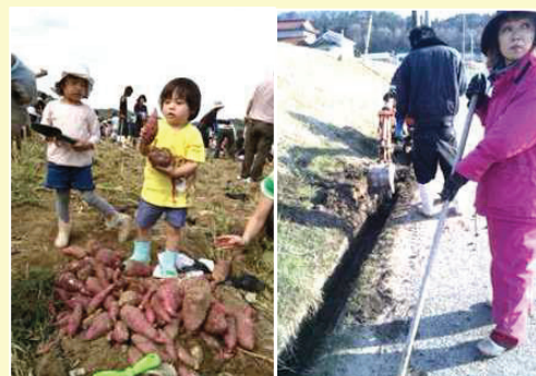
収穫体験 (左) と地域住民総出の水路掃除 (右)