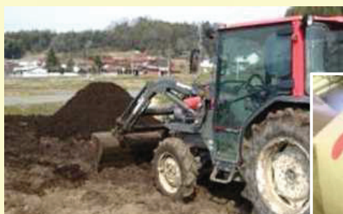
大型機械を用いた堆肥散布作業