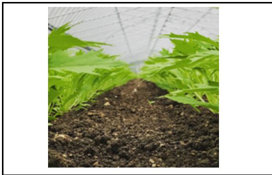
ご視察歓迎します。畑で試食もできます。