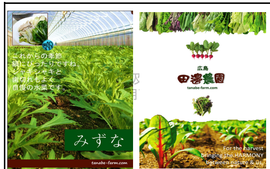
ポップの作成・提供できます