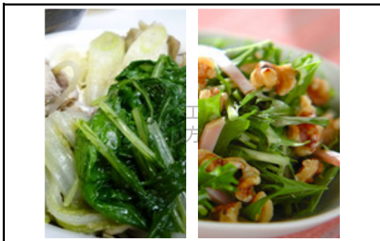
サラダにも鍋にも食感と味が活きます