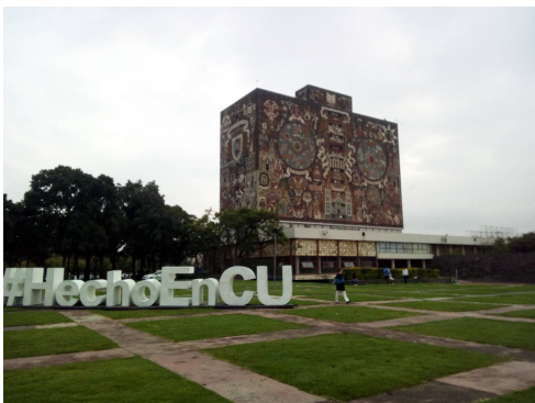
幸せな * UNAM の図書館、実物をもっと圧倒されます