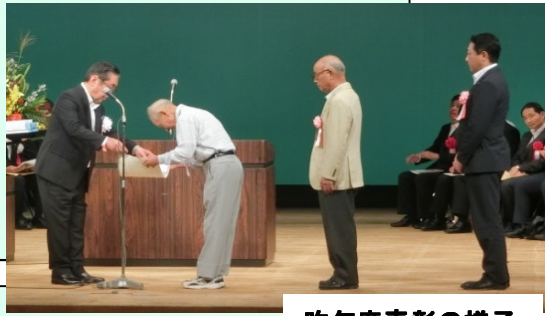
昨年度表彰の様子