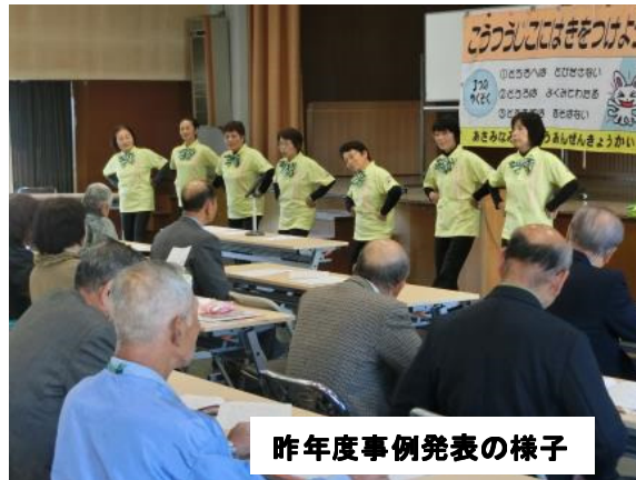
昨年度事例発表の様子

平成30年広島県交通安全 年間スローガン 「危ないよ スマホじゃなくて 周り見て」