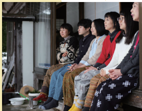
古着物を「もんぺ」として再生

2009年より義母と始めたワンデイショップをきっかけに、実母が着物をリメイクした「もんぺ」の人気が高まる。これを機に友人たちと「もんぺでくらす・はたらく・あそぶ」をテーマにした「もんぺる」を結成。2017年に「さとやま未来大賞2017」大賞を受賞。