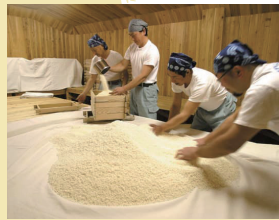
地元の酒米を原料としてお酒を仕込む

昭和8年創業の福光酒造株式会社 四代目蔵元。12年前に廃業した実家の酒蔵を再興すべく、3年前に大朝に帰り、準備を開始。北広島町の特産を活かして、今年度中の「どぶろく」と「葡萄酒」の醸造を目指す。