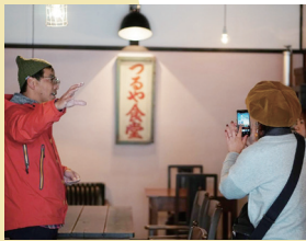
電動自転車で大朝を巡るツアーも実施

大朝生まれ、大朝育ち。大朝商店街の50年を見続け、昔は大人も子どもも集い賑わっていた商店街の再生を目指し奮闘中。またNPO法人INE OASAでは「都市と農村の交流」「環境教育」など、中山間地域の振興を図る幅広い活動を展開。