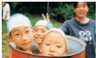
ぼくたちみんな山探険隊(広島市) ドラム缶のお風呂