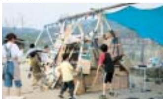
あびきプレーパーク(新市町) 公園でダンボールの基地づくり