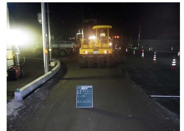
タイヤローラによる締固め