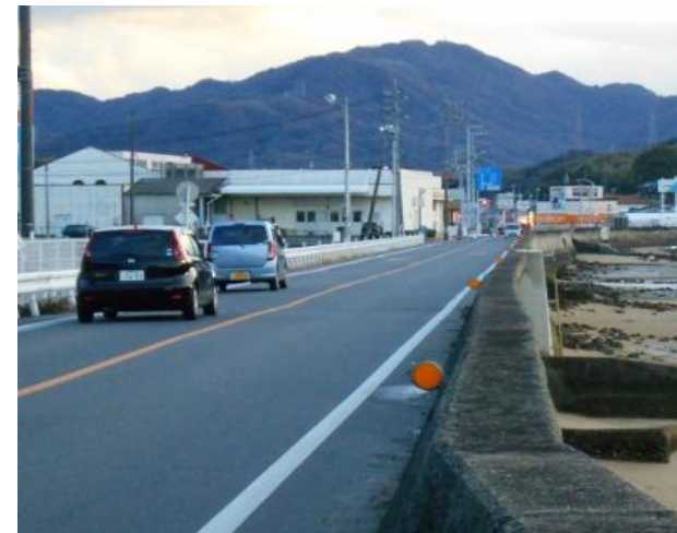
完成後（大柿町方面江南交差点）