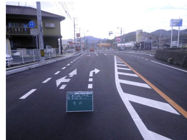
大柿町方面（中町方面右折レーン設置）