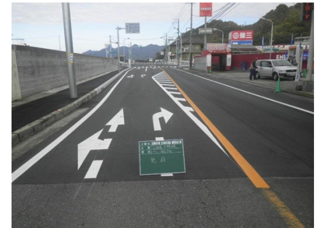
江田島町方面（江南方面右折レーン設置）

現在使われている道路の工事をするため、歩行者通路を確保し工事を進めました。道路外の作業は昼間に行いましたが、道路上の作業は、う回路もなく、交通に与える影響が大きいため、付近の方のご理解をいただき、夜間工事を行わせていただきました。