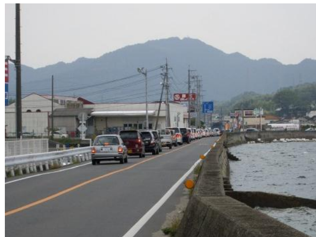
着手前（大柿町方面江南交差点）