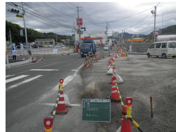
歩行者通路の確保

現在使われている道路の工事をするため、歩行者通路を確保し工事を進めました。道路外の作業は昼間に行いましたが、道路上の作業は、う回路もなく、交通に与える影響が大きいため、付近の方のご理解をいただき、夜間工事を行わせていただきました。