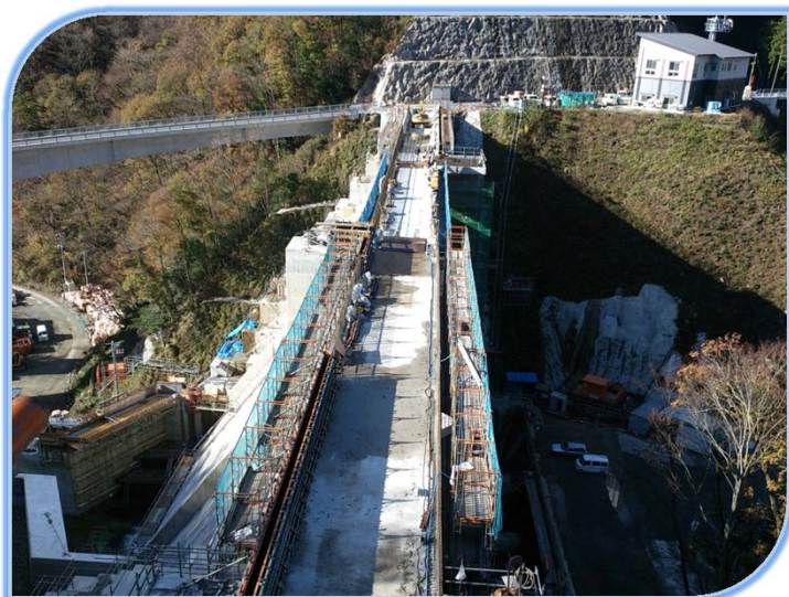
ダム本体天端道路