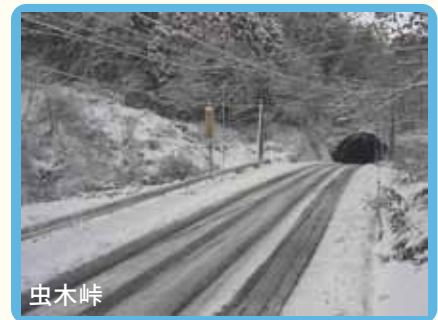
【ひろしま道路ナビ 雪カメラ画像】

虫木峠の標高最高地点に雪カメラ(ライブカメラ)を設置しました。雪カメラの画像は10分間隔で更新し、HP「ひろしま道路ナビ」でリアルタイムに確認できます。モバイル版も提供しておりますので、スマートフォン等でも確認できます。