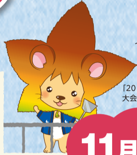
「2016ひろしま総文」 大会マスコットキャラクター もみおん