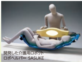
開発した介護用ロボット ロボヘルパー SASUKE