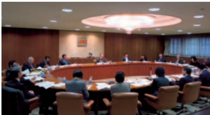
広島県消費生活審議会