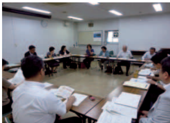
県内消費者団体との意見交換会