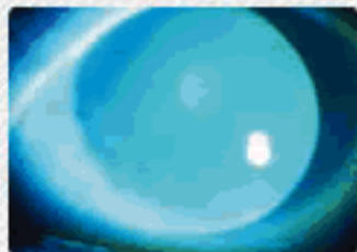
正常な目の断面図