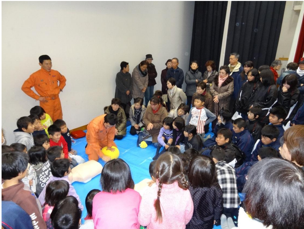
学校区を起点とした地域総出の 合同防災訓練

消防局や学校，地域の企業などと連携しながら地域総出による防災訓練が行われ，自助・共助の大切さについての意識を醸成