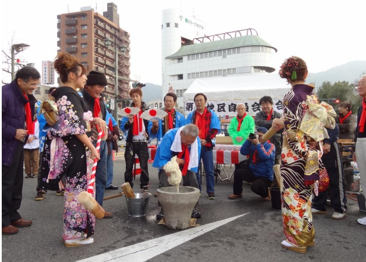
地域主催の成人式

市主催の「成人の日記念式典」を，地域住民の手による，顔と顔が見える，より心の通った「成人式」に移行・発展させて開催（H21～）