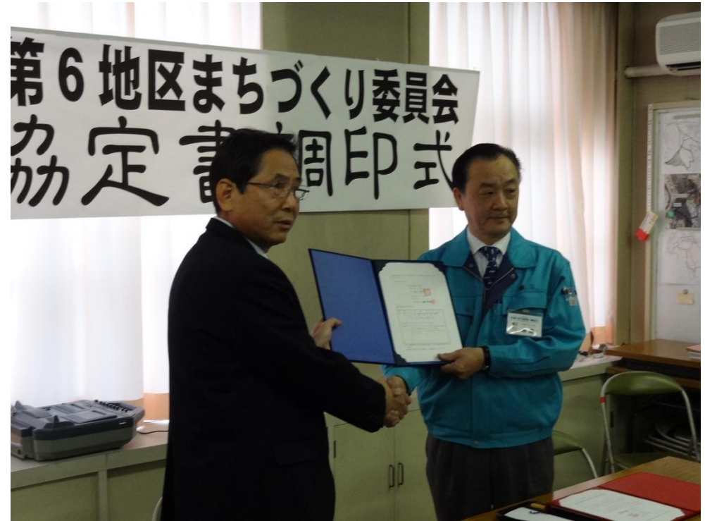
まちづくり委員会と地元企業との 防災協定