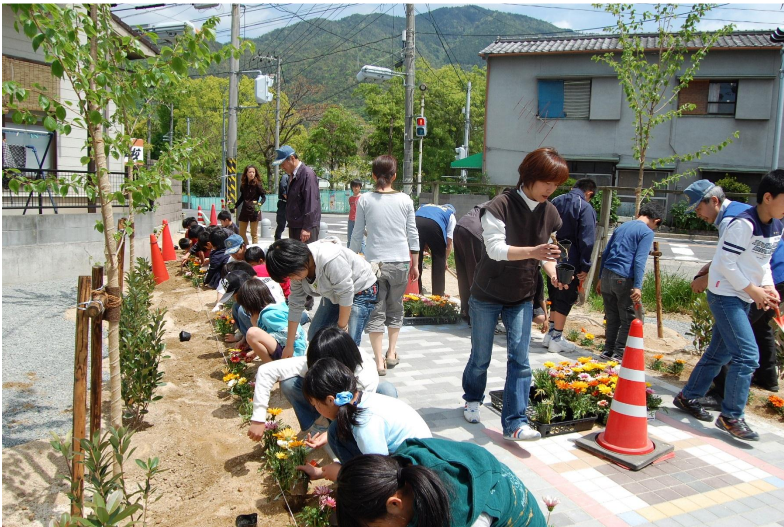
三坂地小学校プロムナード整備

市民の皆さんが、身近な 公共施設の整備を、自ら主体となって企画・実施する事業 に対し、原材料等の購入経費相当額を交付金で交付