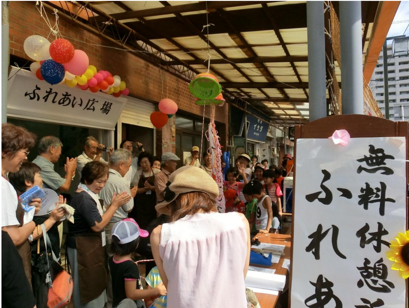
ふれあい広場三条

商店街の空き店舗を活用して、お年寄りが自由に立ち寄ることができる「ふれあい広場三条」を運営