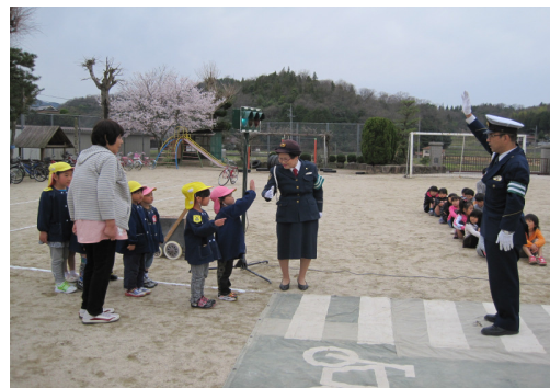
交通指導風景(沼田西小学校・幼稚園/4月15日)