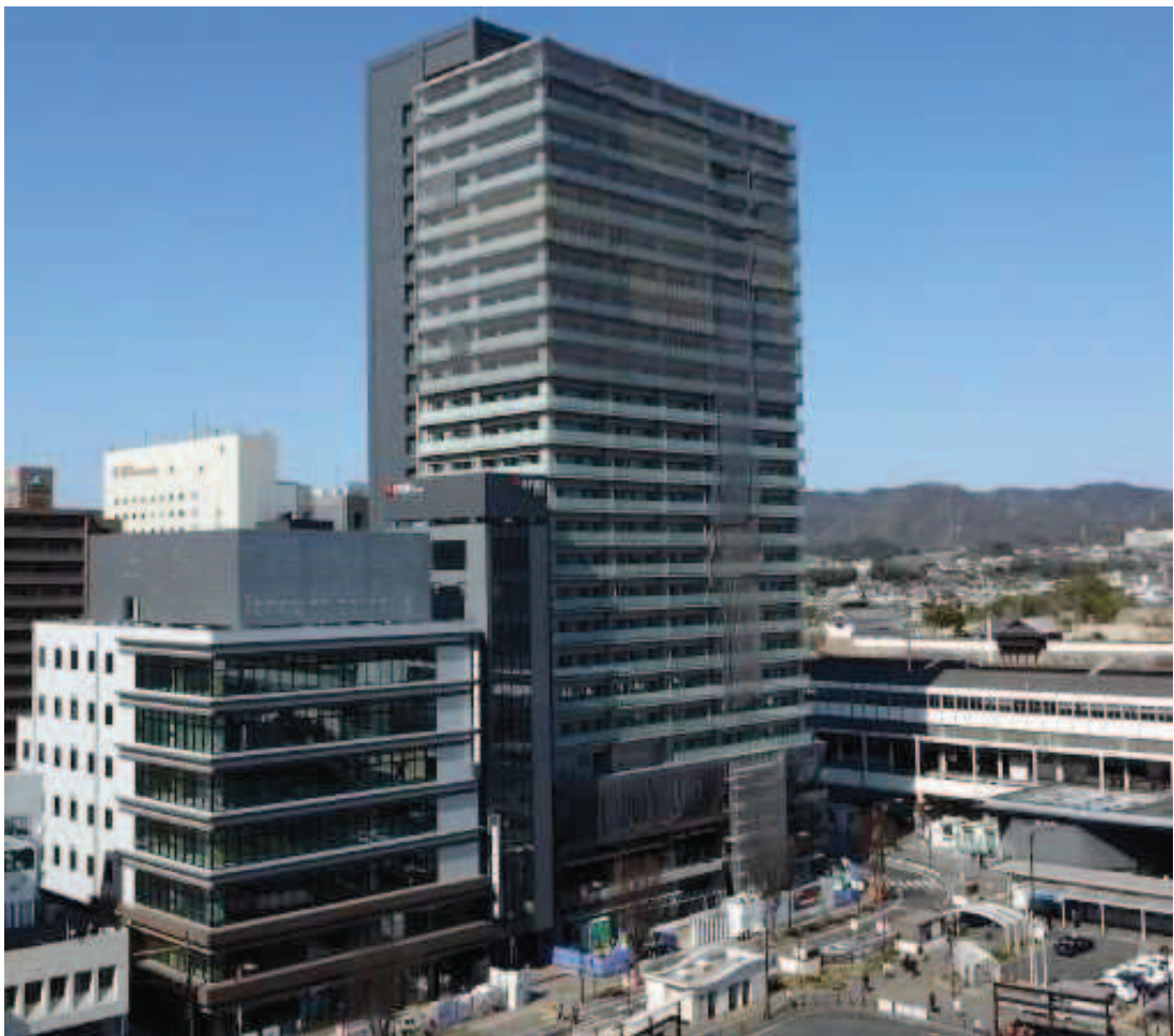
(仮称) 福山市三之丸町1番地区再生事業