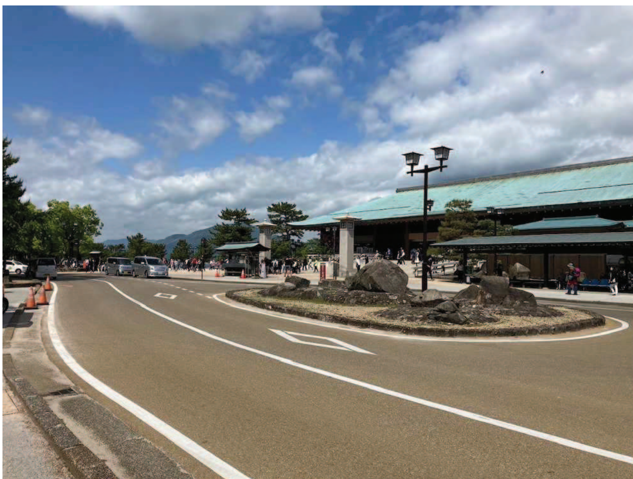
G7広島サミットにかかる道路の環境整備（舗装補修）