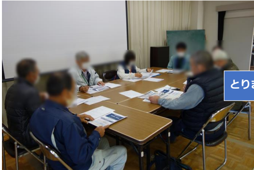
避難所運営会議の様子 (中通地域交流センター)