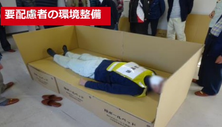
要配慮者対応の訓練の様子（中通地域交流センター）