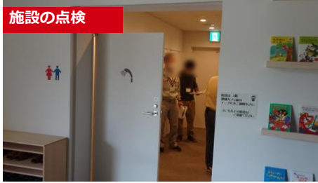
施設の点検の様子（熊野東防災交流センター）