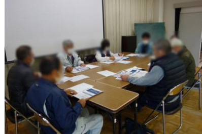
避難所運営組織による会議の様子（中通地域交流センター）